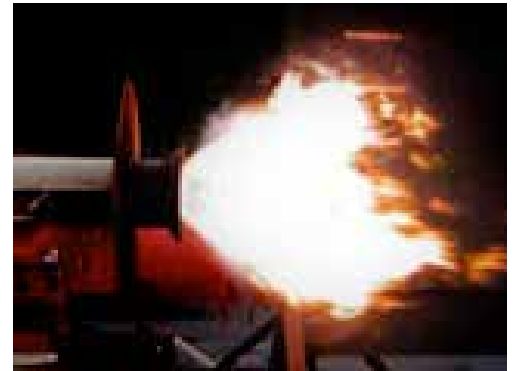
La llama compacta posibilita que el quemador Fury funcione con casi todos los diseños de tambores.