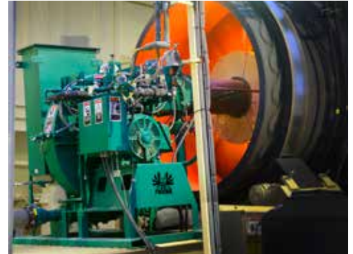
La fabricación sencilla del quemador facilita su mantenimiento.