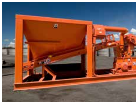
El depósito de preparación de carbón pulveriza el carbón para uso del quemador.

La mezcla de alta calidad de aire y combustible crea la llama más compacta disponible con una zona de combustión pequeña. Esto asegura que todo el combustible se queme para una máxima eficiencia sin restar la valiosa capacidad de calentamiento del secador.