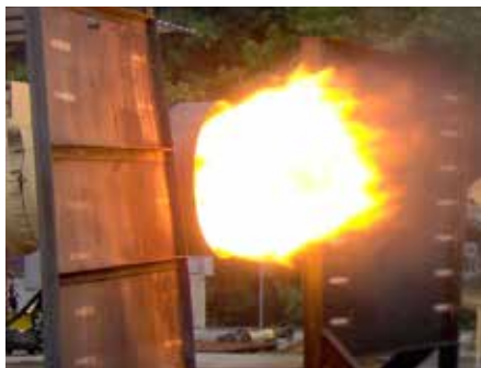
ASTEC prueba los quemadores antes de enviarlos para garantizar su calidad.